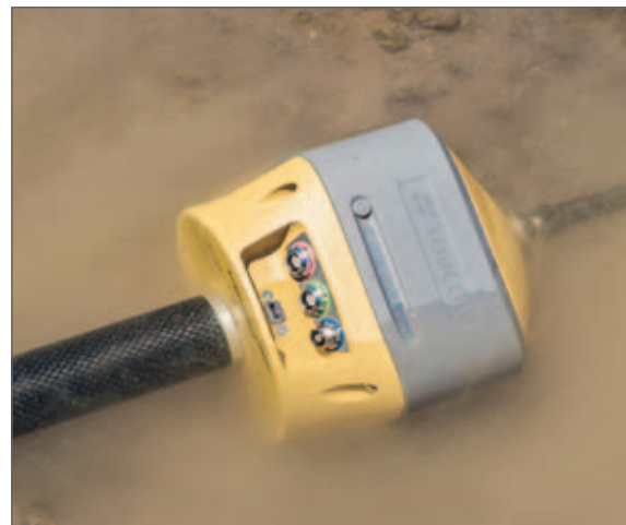
Wasserdicht nach Schutzart IP67

Mit TILT™ verlieren steile Hänge und schwer erreichbare Stellen ihren Schrecken.